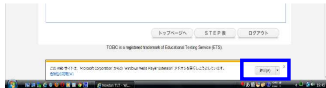
Internet Explorer 9

画面が一度真っ白になり、「情報を送信しなおす…」という内容のコメントの画面が表示されることがあります。その場合には、「再試行」をクリックして学習をお試しください。