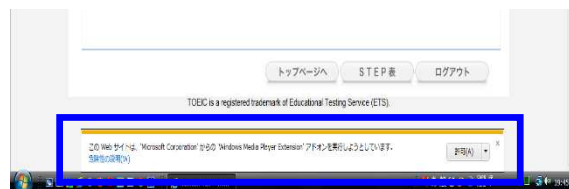
Internet Explorer 9

「Internet Explorer 7、8」の場合には、画面上部の情報バー（薄黄色の部分）をクリックするとメニューが表示されるので、「ActiveX のインストール(または“実行”）」(IE8 の場合は、アドオンの実行)をクリックしてください。「Internet Explorer 9」の場合には、「許可」をクリックしてください。