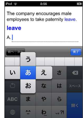
テンキーモード (フリック入力)